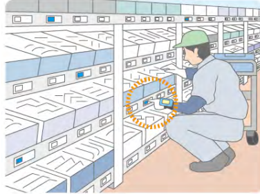
デジタルピッキングによる ペーパーレス化を実現