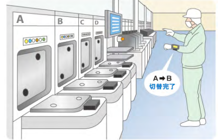
ウェアラブルターミナルの操作により 段取り替えが可能

遠隔操作・監視をはじめとする IoT を手軽に実現できる、IDEC のプログラマブルコントローラ「FC6A 形」などにつなげることで、さまざまな機器と連携することができ、多様な設備の制御が可能となります。また、プログラマブル表示器と接続することによりリアルタイムでモニタ管理を行うことができ、スマート工場の実現に貢献します。