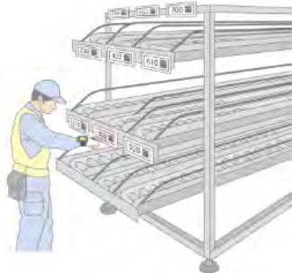
ヒューマンエラーによる 部品の誤投入を防止

ウェアラブルターミナルやハンディターミナルを導入することで、生産現場の効率化に加え、安全性や品質の向上を図ることができます。