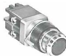
EBNF シリーズ 押ボタンスイッチ