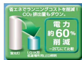
低温場所における蛍光灯との比較