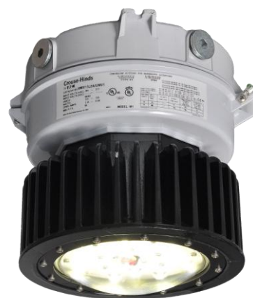
使用用途に応じた配光特性を2種展開

また、使用温度は業界初の+55℃まで対応、その場合でも器具寿命6万時間以上と圧倒的な長寿命を実現し、過酷な温度環境でもお使いいただけます。これらにより、ユーザーの使用環境に応じた最適な照度設計が可能となり、幅広い要求にお応えいたします。