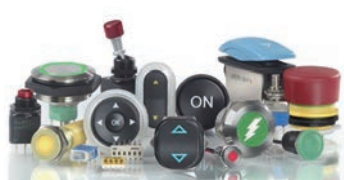
スイッチのコンポーネント