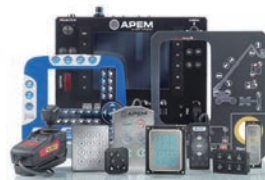
パネルソリューション