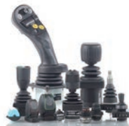
ジョイスティック