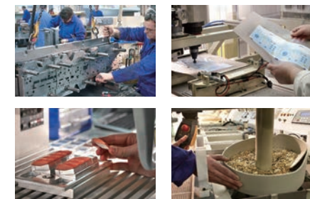
各工程を一括管理

また、独自のコンポーネントを組み込んだ、ジョイスティックやパネルソリューションをお客さまに提供することができる点も、APEMの品質保証につながっています。