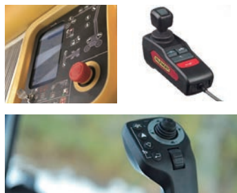
人間工学に基づきカスタマイズしたソリューション事例