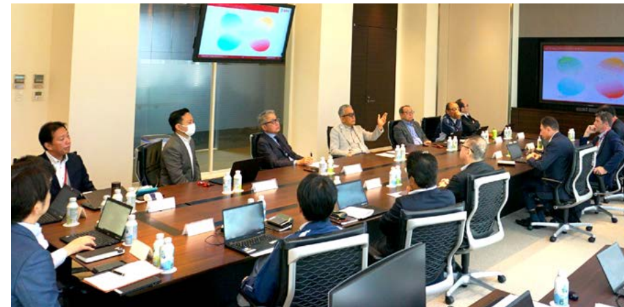
サステナビリティ委員会