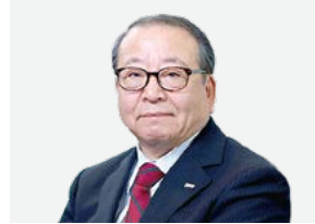
取締役 常務執行役員

2006年に代表取締役専務に就任。当社および当社グループ会社で、海外事業を中心に豊富な経験と実績を有しています。