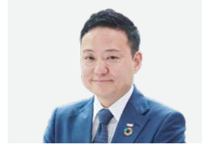
取締役 上席執行役員

オムロン株式会社の執行役員、海外CEOの経験を経て当社取締役に就任しました。制御機器業界における豊富な経験と実績を持っています。