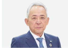
代表取締役 会長兼社長