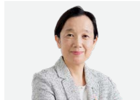
社外取締役 社外 独立

弁護士。2016年に当社の社外取締役役に就任しました。弁護士としての高度な専門的知識から、法律に関する当社の監査体制の強化に寄与しています。