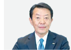
社外取締役 社外 独立

IDEC USAに入社後、Australia、Germanyの責任者も務めました。当社執行役員とAPEM Inc.の社長を兼務し、北米事業とSCM、生産の強化を担います。