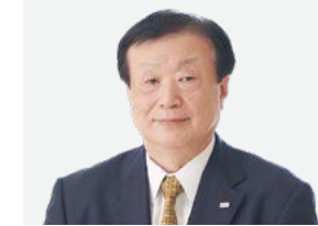
社外取締役 社外 独立

本田技研工業株式会社にて常務執行役員、アジア大洋州本部部長などの経験を有しています。国内外の豊富な経験と、自動車業界での知見を持っています。