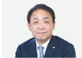
代表取締役 専務執行役員

1997年に代表取締役に就任。国際ビジネスや業界の知見など、経営者としての豊富な経験と実績を有しています。