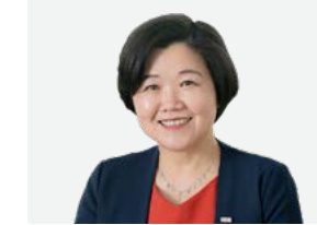
社外取締役 社外 独立

三菱電機株式会社の代表執行役員などを務め、FAシステム事業、輸出管理、生産システムを担当しました。FA業界への深い知識と、広い経験を持っています。