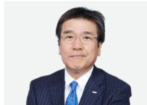
社外取締役 社外 独立