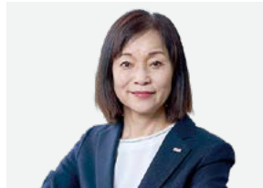
社外取締役 社外 独立

公認会計士。2020年に監査等委員である社外取締役として就任しました。財務・会計の視点で監査体制強化に寄与しています。