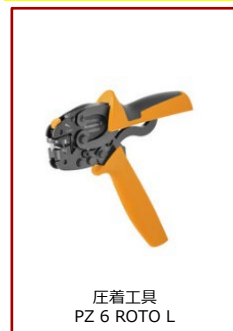
圧着工具 PZ 6 ROTO L