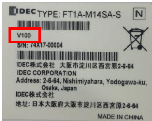
(個装ケース上のバージョン記載)

FT1A形 Touch Tr.出カタイプ V100 FT1A-M14***、FT1A-C14*** システムソフトウェア Ver.4.00