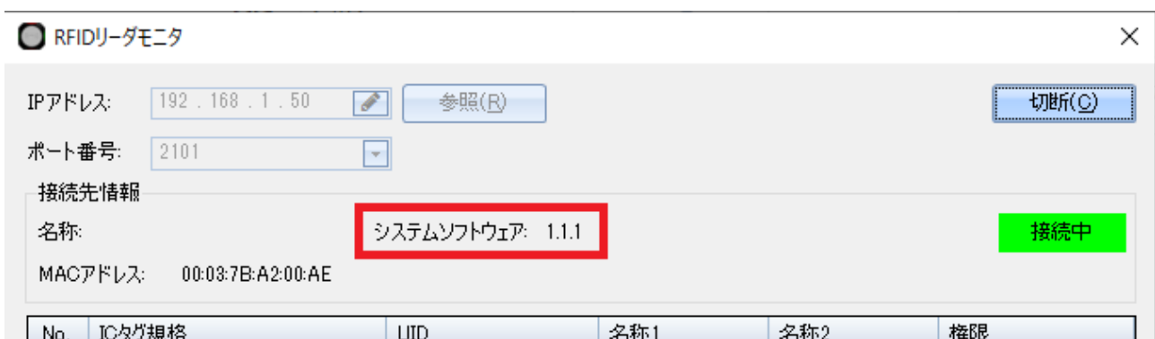
図3 設定ツールのモニタ画面