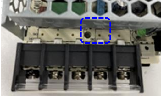
【変更前】ジャンパー線短い