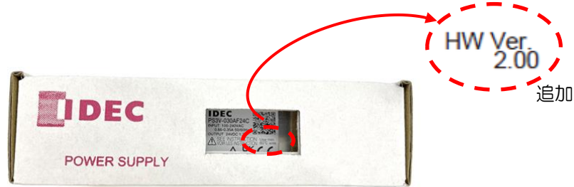
梱包箱写真: 変更前品

変更後の製品は、製品ラベルにハードウェアバージョン「HW Ver.2」を追加いたします。 (下図のように、梱包箱側面に設けた角穴により、製品に貼付したラベルの確認ができます)