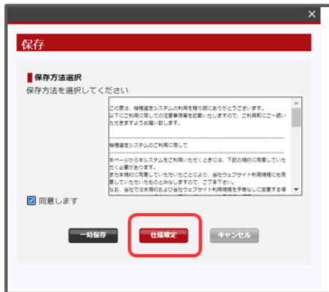
仕様確定をクリック