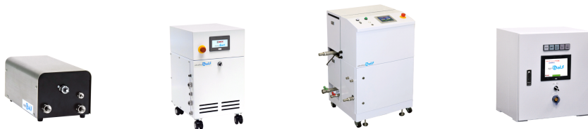
( FZ1N-04M 形 / FZ1N-05 形 / FZ1N-10 形 / agriGaLF15 形 )