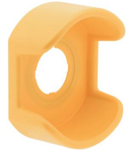
φ30 非常停止用押ボタン スイッチのスイッチガード

スイッチガードは、各種機器に設置した非常停止用押ボタンスイッチの、意図しない操作を防止する製品です。従来は、半導体製造装置で使われる緊急遮断用 EMO スイッチにのみスイッチガードの使用が認められていましたが、2015年に国際規格 ISO13850*が改定され、半導体製造装置以外の工作機械、食品機械、その他一般機械でも条件付きで使用が認められることとなりました。