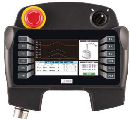
ティーチングペンダント 「HG1P形」

ロボットのティーチング作業はもとより、広大な生産ライン、大型装置などへの配置により、省人化やメンテナンス作業の効率化などにも貢献します。