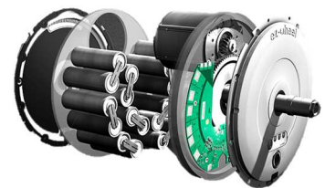
電動アシストホイールの構造

ハンドルとホイールをワイヤレスで通信することで配線が不要な「ワイヤレスタイプ」と、シンプルな配線で構成できる「省配線タイプ」があり、産業、医療、食品、屋外といった用途に応じた製品をラインアップしています。