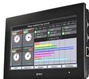
プログラマブル表示器 「HG2J形」

近年、半導体部品を始めとする部材の供給問題により、プログラマブル表示器製品が市場で供給不足になっておりますが、本製品については、十分な製品在庫と部品在庫を確保し、安定的な供給と、即出荷体制を整えて発売を開始いたします。